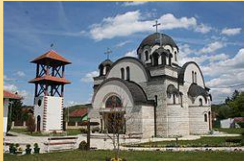
Црква Свете Марине у Бањи Врујци